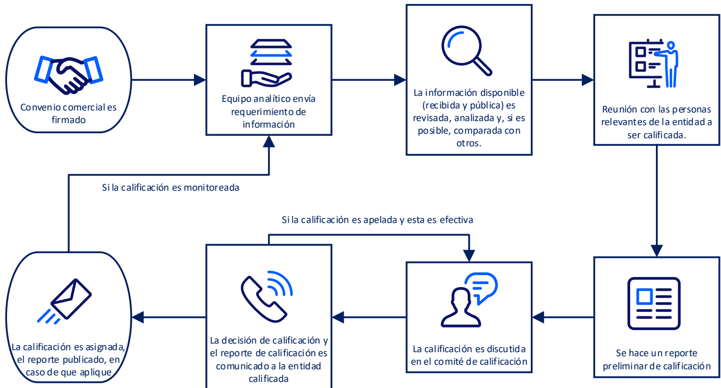
FIGURA 2 Representación gráfica del proceso de calificación

El proceso de calificación se divide en dos etapas diferentes: el proceso de calificación inicial y el proceso de supervisión de la calificación. En general, el proceso para ambas etapas se describe en el siguiente gráfico.